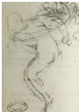
Vinci Léonard de (1452-1519), Manuscrit K, fol. 14 verso : Nageur.

Parc stationnement : Mazarine (27 rue Mazarine, 75006 Paris)