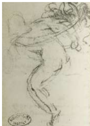
Vinci Léonard de (1452-1519), Manuscrit K, fol. 14 verso : Nageur.

Parc stationnement : Mazarine (27 rue Mazarine, 75006 Paris)